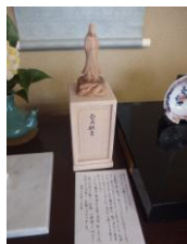
「白寿観音」と依頼主からの御礼状