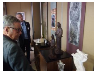
先生の特徴ある“気をつけタイプ”の獅子頭と天神様立像