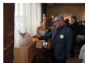
作品室には、大作や日展原型が…