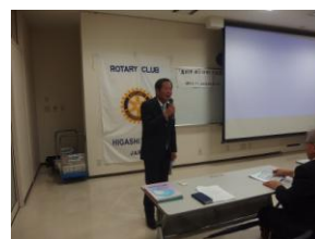
花田高岡RC会長の閉会の辞

高岡市保育園関係者50名が参加、フッ化物洗口のテキストを各園に贈呈。RC・歯科医師会からは20名参加があり、大好評でした。参加RCから次年度への継続も了承。